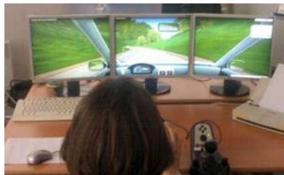
Vue générale de l'outil